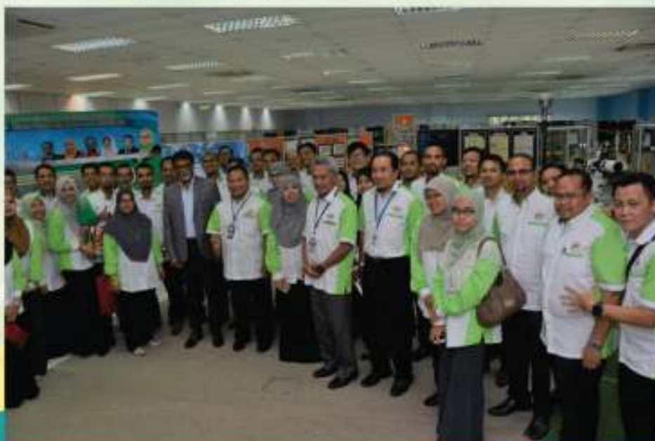
Bergambar kenangan Bersama YB Menteri