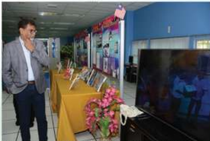
YB Menteri KATS membaca sejarah negara @ Pameran Aspirasi Perpaduan Perdana