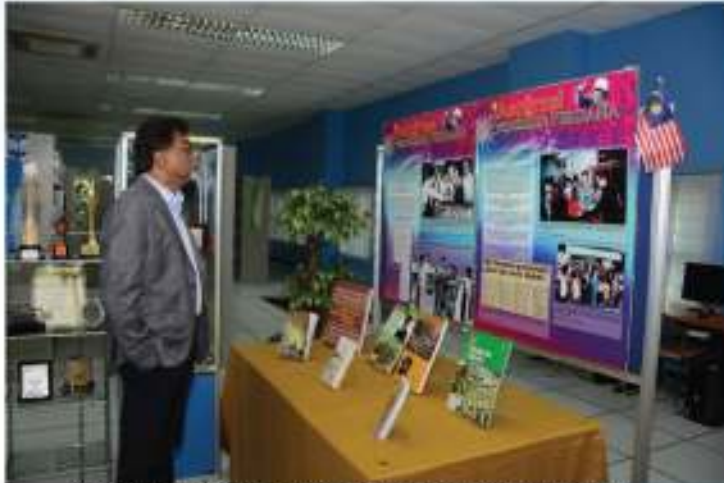
YB Menteri KATS meninjau Pameran Aspirasi Perpaduan Perdana

Pameran Aspirasi Perpaduan Perdana Sempena Bulan Kemerdekaan 2018 telah di adakan bermula 15 Ogos hingga 31 Ogos di Perpustakaan INSTUN. Tujuan program ini adalah untuk meningkatkan kesedaran, kefahaman dan pengetahuan warga INSTUN mengenai erti kemerdekaan selain turut menyemai rasa kecintaan kepada negara, menyuburkan semangat patriotisme dan menghayati tema "Sayangi Malaysiaku". Melalui penganjuran program ini, ia dapat memupuk budaya membaca dalam kalangan warga INSTUN khususnya dan kepada peserta-peserta kursus amnya. Pameran ini telah dimeriahkan dengan kehadiran lawatan oleh YB Menteri Air, Tanah dan Sumber Asli (KATS) sempena Majlis Pelancaran Kempen Kibar Jalur Gemilang dan kehadiran peserta Program Management Retreat Kementerian Air, Tanah dan Sumber Asli (KATS) Bilangan 1 Tahun 2018.