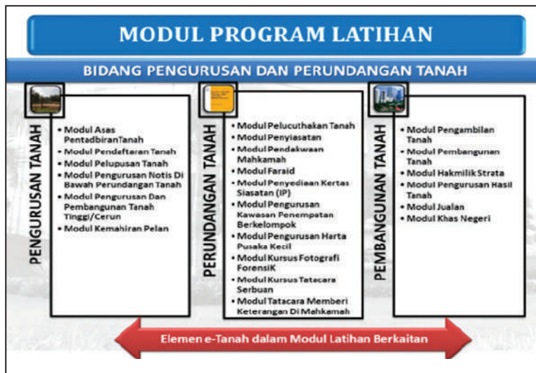
Rajah 4. Modul Program Latihan Bidang Pengurusan dan Perundangan Tanah