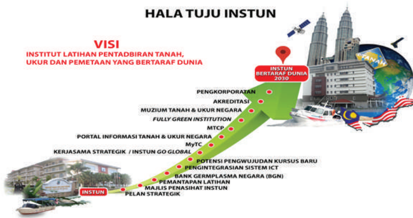
Rajah 7. Hala tuju INSTUN

dan aktiviti telah dijalankan bersama masyarakat tempatan seperti program CSR. INSTUN telah mengadakan Memorandum of Understanding (MoU) bersama Institut Pengajian Tinggi Awam (IPTA) seperti Universiti Pendidikan Sultan Idris (UPSI), Universiti Teknologi MARA (UiTM) Perak, Universiti Tun Hussein Onn (UTHM) dan Jabatan Mufti negeri Perak dalam bidang berkaitan dan menjalankan perkongsian pintar dari segi sumber dan teknologi supaya lebih banyak peluang dapat diterokai.