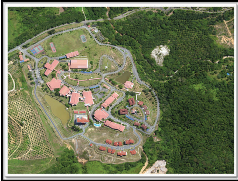
Rajah 1. INSTUN dari pemandangan udara