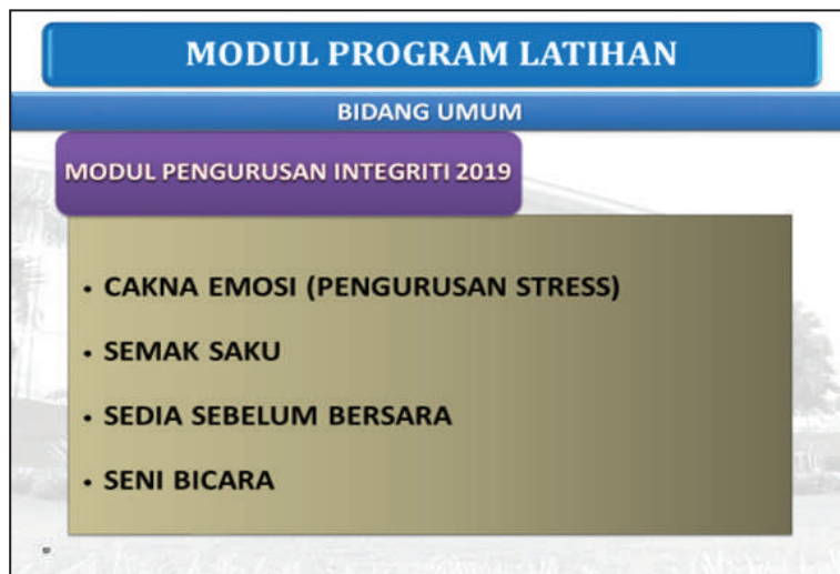
Rajah 6. Modul Program Latihan Bidang Umum