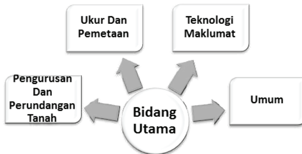
Rajah 2. Bidang utama program latihan INSTUN

Terdapat empat bidang utama yang ditawarkan oleh INSTUN melalui program latihan yang komprehensif iaitu bidang pengurusan dan perundangan tanah, ukur dan pemetaan, teknologi maklumat dan umum seperti yang ditunjukkan dalam Rajah 2. Setiap bidang mempunyai program latihan yang khusus seperti Modul Program Latihan Bidang Ukur dan Pemetaan (Rajah 3), Modul Program Latihan Bidang Pengurusan dan Perundangan Tanah (Rajah 4), Modul Program Latihan Bidang Teknologi Maklumat (Rajah 5) dan Modul Program Latihan Bidang Umum (Rajah 6).