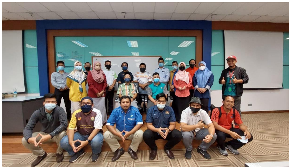
Gambar 11: Barisan urus setia dari Jabatan/ Agensi Kerjasama yang menjayakan SARAS 2021