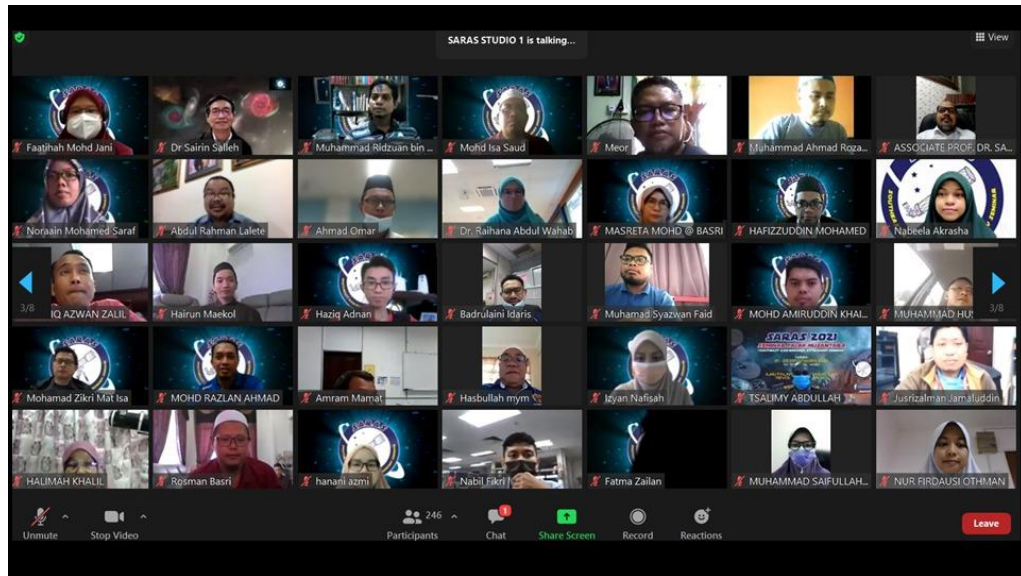
Gambar 1: Penyertaan SARAS yang terdiri daripada peserta pihak Kerajaan, pihak swasta, penyelidik di Institusi Pengajian Tinggi (IPT), pelajar, orang awam yang berminat mendapatkan ilmu dalam bidang falak/ astronomi dan penyertaan daripada MABIMS iaitu Pertemuan Tahunan Tidak Rasmi Menteri-Menteri Agama; Negara Brunei Darussalam, Republik Indonesia, Malaysia dan Republik Singapura