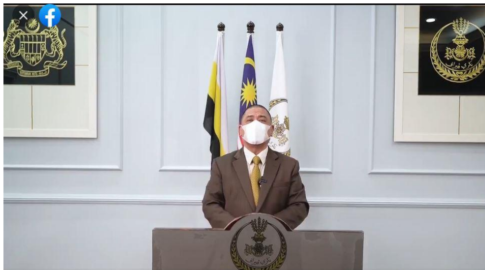
Gambar 6: Penutup SARAS 2021 disempurnakan oleh YAB Dato' Saarani bin Mohamad, Menteri Besar Perak Darul Ridzuan