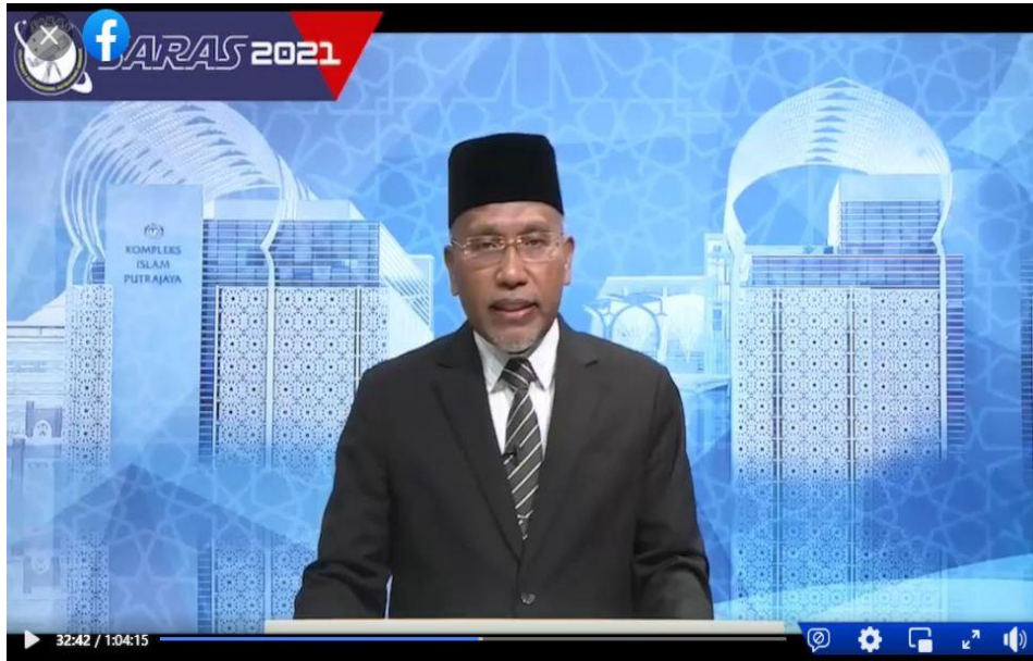
Gambar 5: Perasmian Seminar SARAS dirasmikan oleh YB Senator Tuan Haji Idris bin Ahmad, Menteri di Jabatan Perdana Menteri (Hal Ehwal Agama)