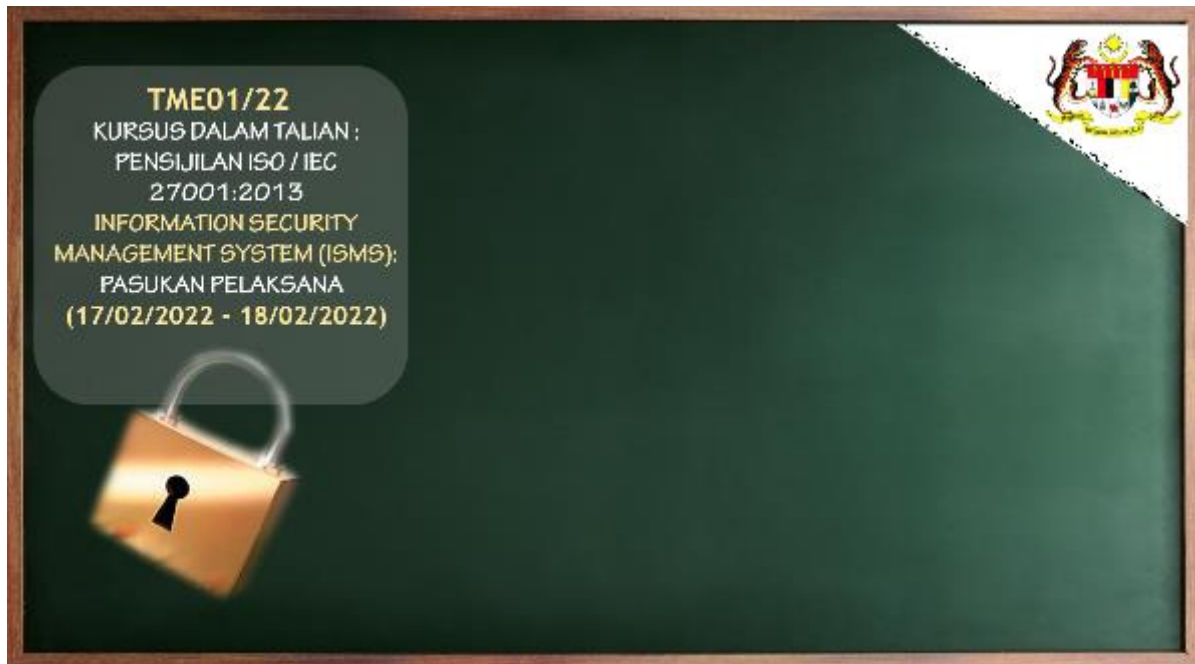
Latar Belakang bagi Video Zoom