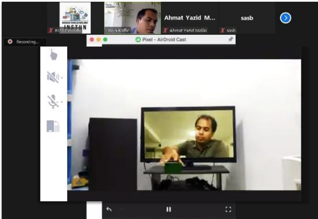
Penceramah menunjukkan contoh video menggunakan smartphone hasil daripada teknik Chroma Key