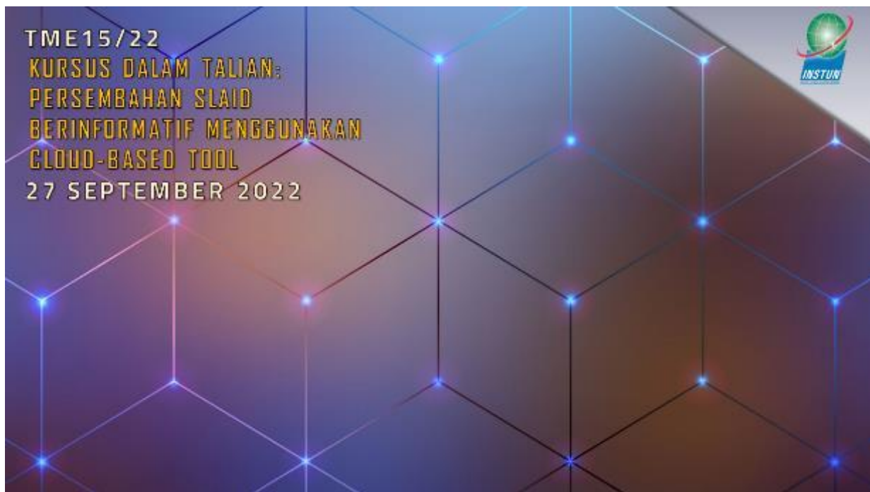
Latar Belakang bagi Video Zoom