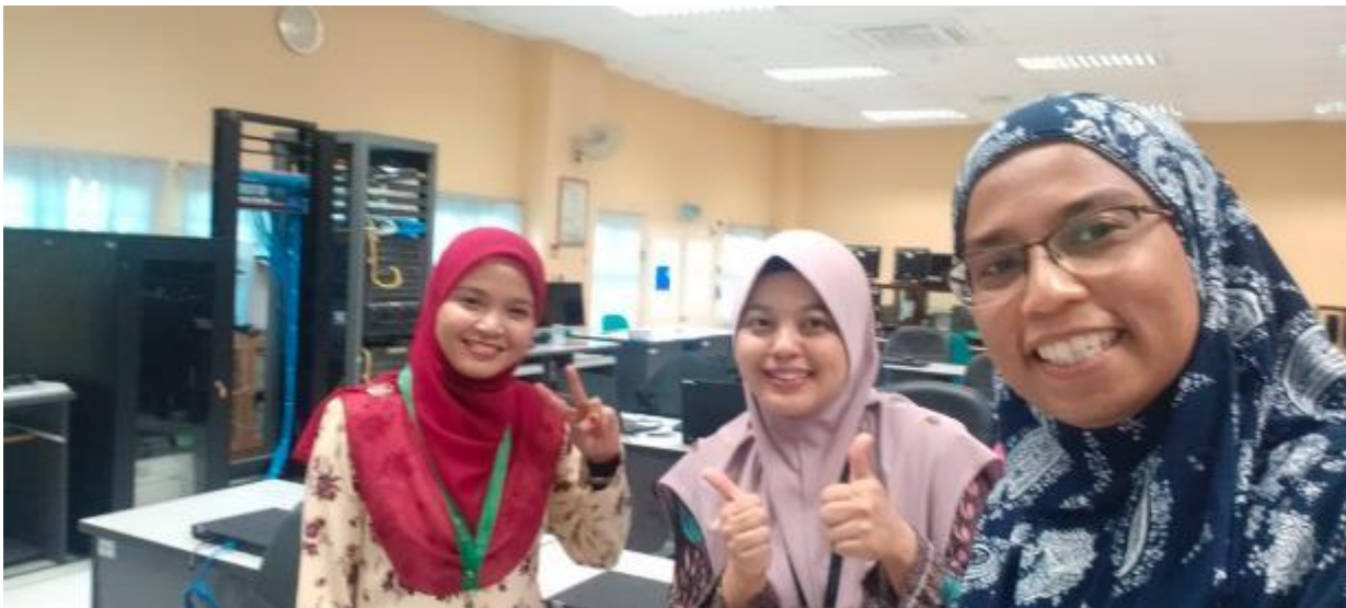
Barisan Penceramah dan Urusetia.