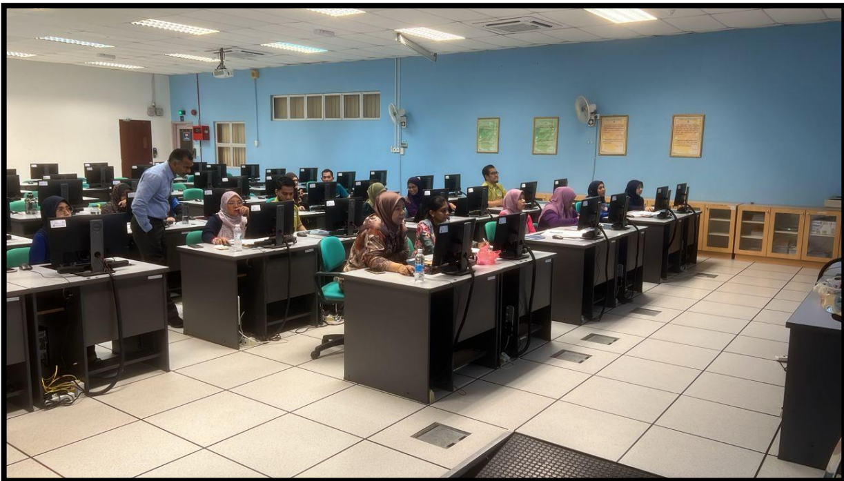
Pentadbir SKU menyemak dan mengunci masuk sub SKU ke dalam MyPerformance mengikut Bahagian/ Seksyen masing-masing