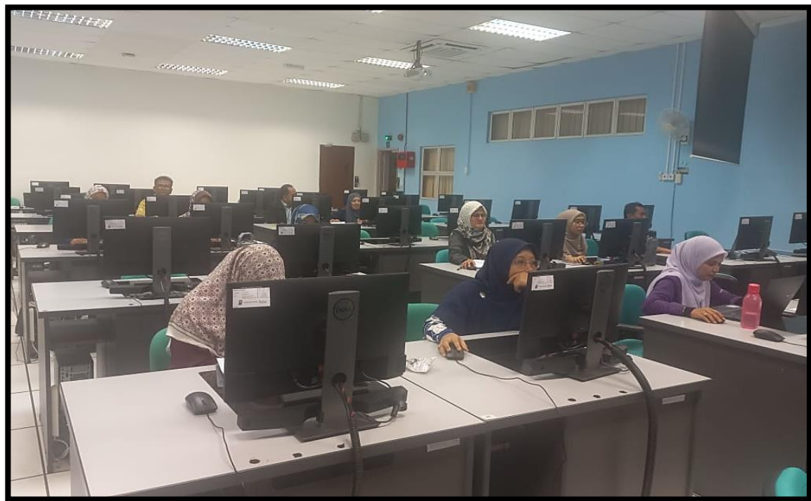
Pentadbir KKF menyemak dan mengunci masuk KKF ke dalam MyPerformance mengikut Bahagian/ Seksyen/ Unit masing-masing